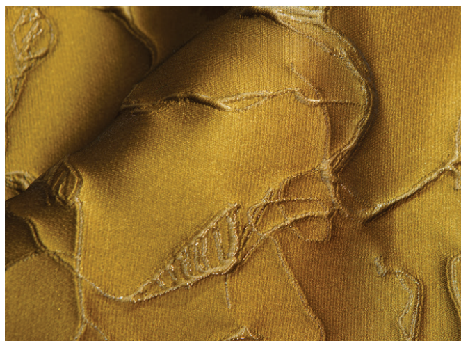
© RUFFO COLI TESSUTI / PREMIÈRE VISION FABRICS