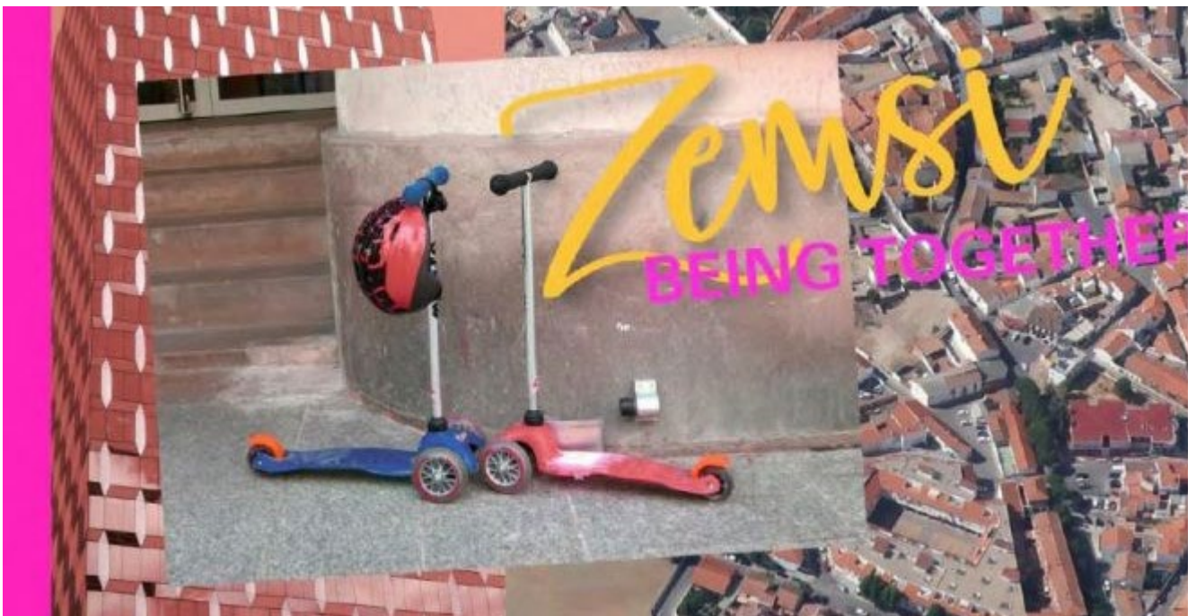
A través de siete grandes líneas, Nora Kühner saca a